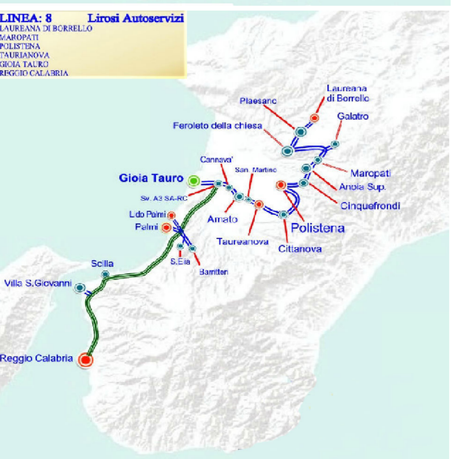
Percorsi Autobus FERROVIE CALABRO LUCANE che collegano Polistena agli altri comuni della Provincia